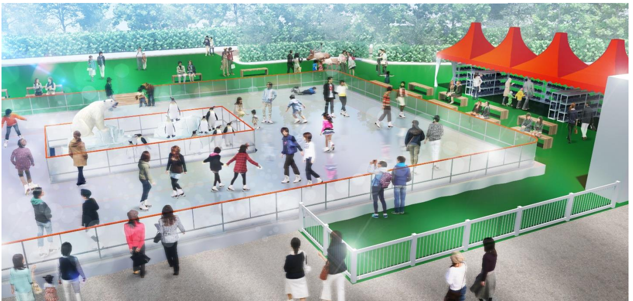
【「てんスケ」 イメージ】