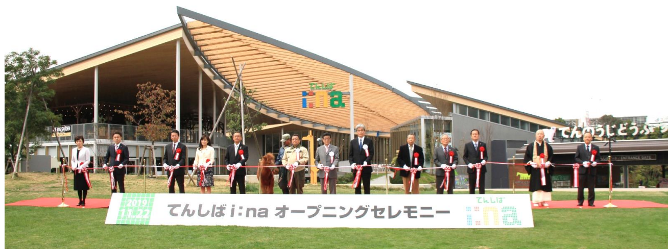
【オープニングセレモニーの様子】