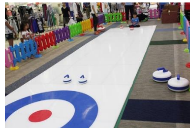
■カーリング体験(イメージ)