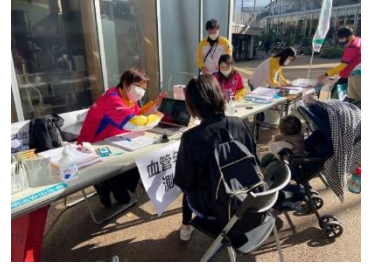
■測定風景(イメージ)