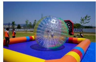
■ゾープボール体験(イメージ)