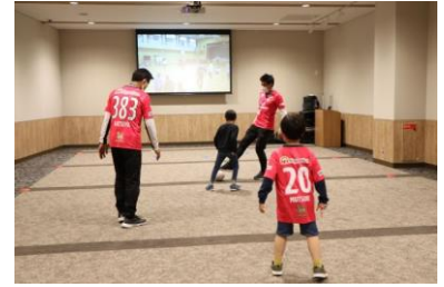
■ウォーキングフットボール体験(イメージ)