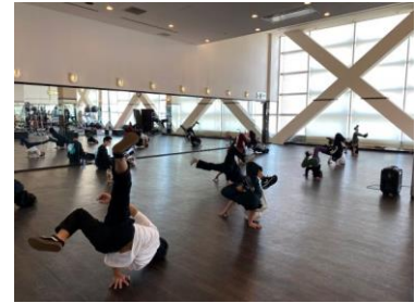
■ダンスワークショップ(イメージ)