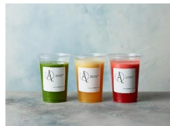
■アンサースムージー(イメージ)