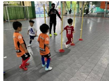
■フットサル体験(イメージ)