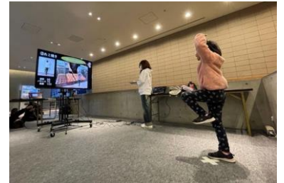
■ヘラヘラフラフラ大阪観光ツアー(イメージ)