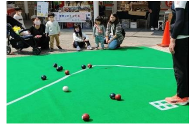
■ポッチャ体験(イメージ)