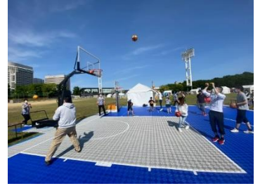
■バスケットボール体験(イメージ)