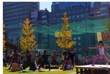
■プチヨガ風景(イメージ)