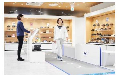
■歩行測定(イメージ)