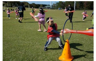
■忍者学校(イメージ)