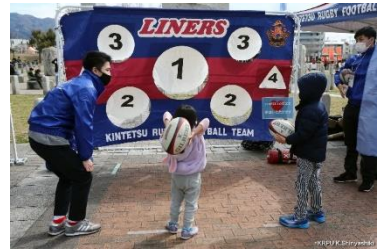
■ラグビー体験(イメージ)