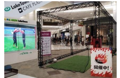
■激ムズチャレンジ(イメージ)